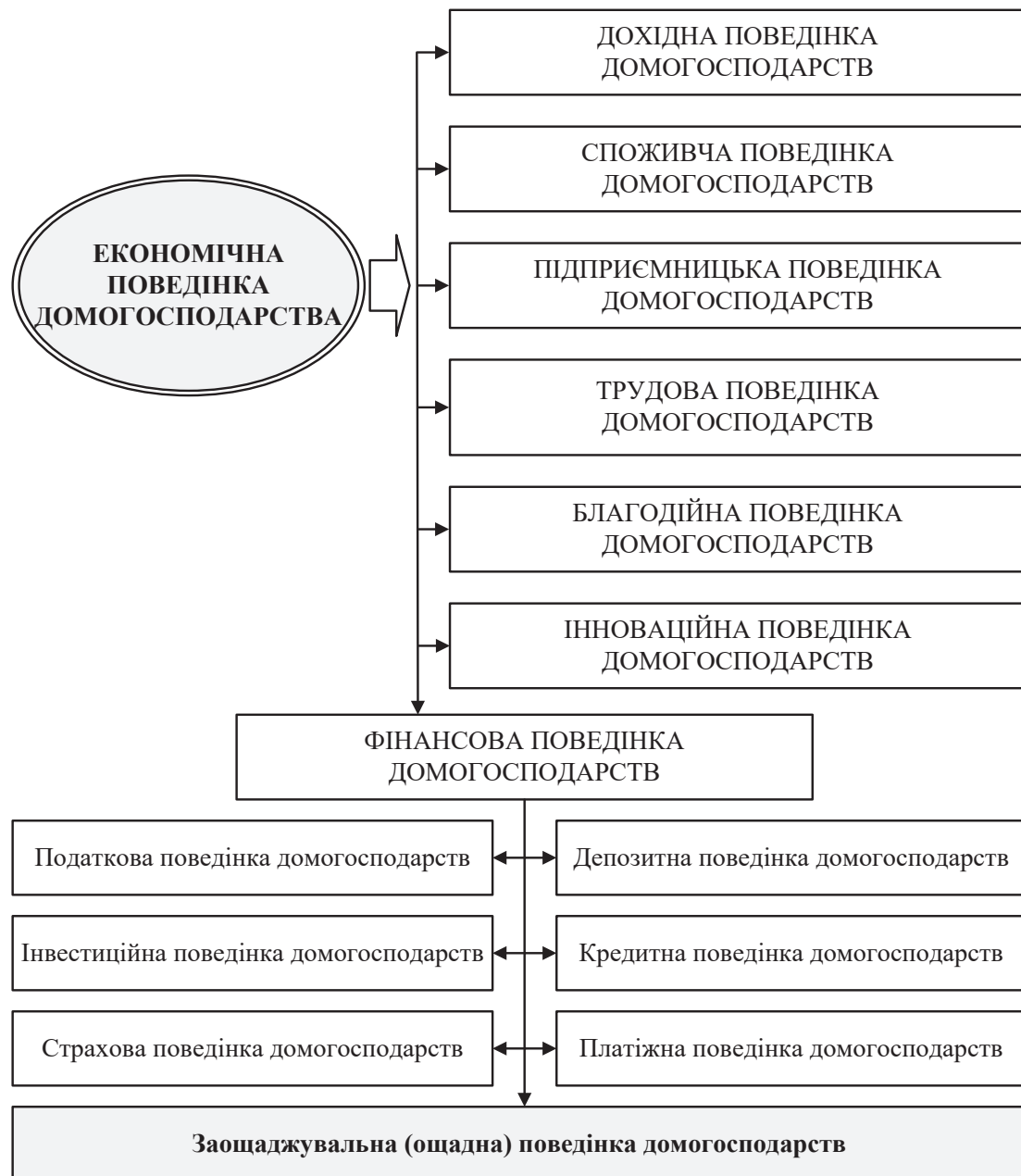
Рис. 2. Структура системи економічної поведінки домогосподарств

Джерело: складено автором з урахуванням [2; 3, с. 170; 6]