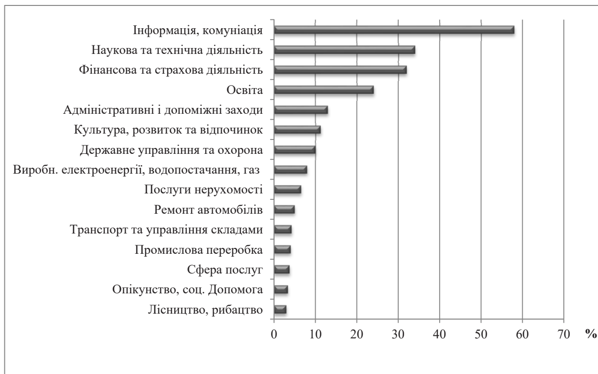
Рис. 2. Частка зайнятих людей, які через епідемічну ситуацію працювали віддалено у зазначених розділах польської класифікації видів діяльності на початку III кварталу 2020 р.

У третьому кварталі 2020 року кількість економічно активних людей віком від 15 років становила 17 074 тис. осіб, з них: 16 512 тис.