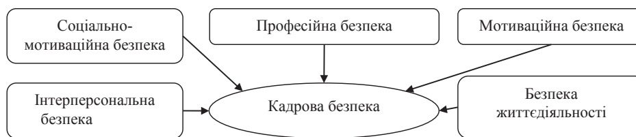
Рис. 2. Складники кадрової безпеки підприємства