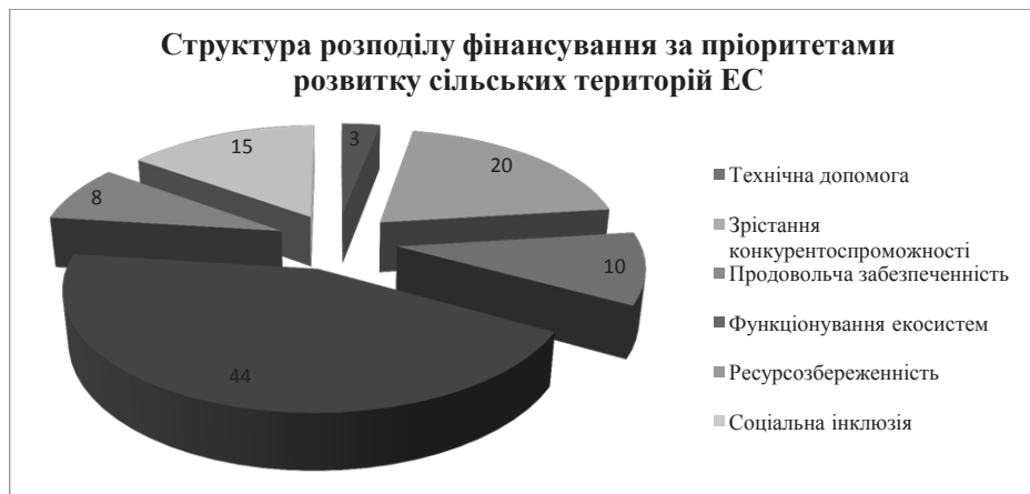
Рис. 2. Структура розподілу фінансування за пріоритетами розвитку сільських територій ЄС, %