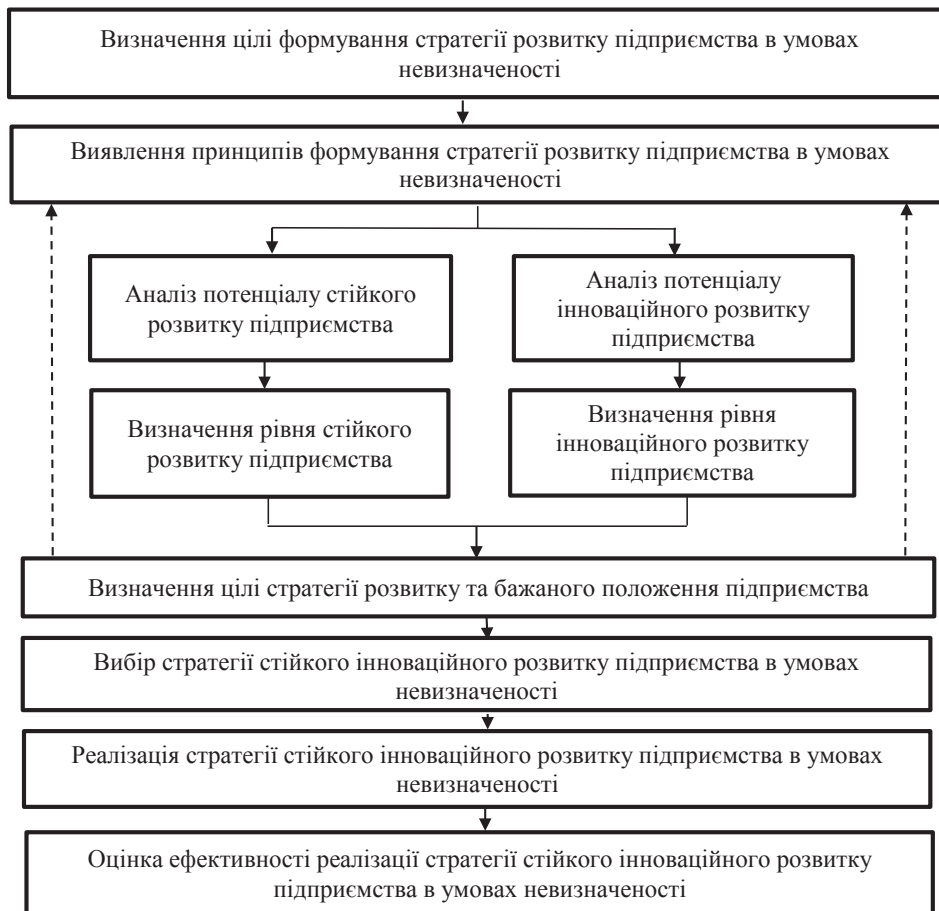
Рис. 2. Алгоритм формування стратегії сталого інноваційного розвитку підприємства в умовах невизначеності

Аналіз потенціалу інноваційного розвитку (ІР) підприємства в умовах невизначеності пропонується