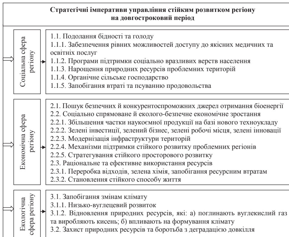
Рис. 2. Стратегічні імперативи управління для досягнення стійкого розвитку регіону

Стратегічні імперативи управління для досягнення стійкого розвитку регіону мають бути скориговані у відповідності з екологічними інтересами. Нерозривно пов’язана з досягненням стійкого роз-