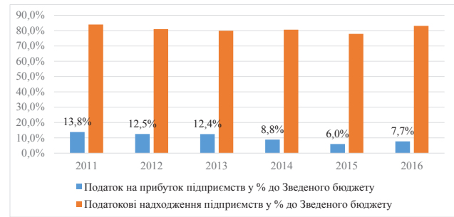
Рис. 3. Податок на прибуток підприємств у загальній сумі податкових надходжень зведеного бюджету

зменшення частки податку на прибуток у податкових надходженнях.