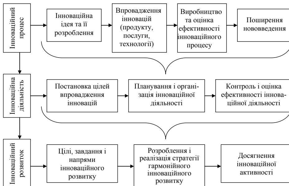
Рис. 1. Взаємозв'язок та взаємозалежність основних категорій інноваційного розвитку

Аналіз авторських підходів до трактування поняття «інноваційний розвиток підприємства» дає змогу стверджувати, що погляди вчених-економістів є неоднорідними, а сутність досліджуваного явища розглядається через: інновації як джерело інноваційного розвитку, розгортання інноваційного процесу, ототожнення з інноваційною діяльністю, здійснення якісних змін у межах підприємства та тісний взаємозв'язок з його інноваційним потенціалом [6–11]. Такі підходи до визначення інноваційного розвитку підприємства, на нашу думку, пов'язані із сформованими поглядами щодо його складників.