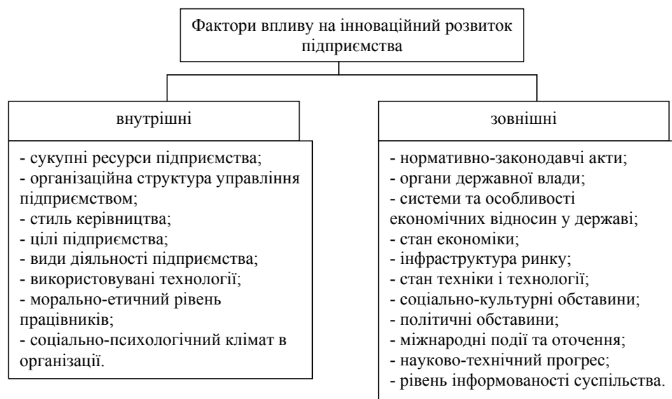
Рис. 3. Внутрішні та зовнішні фактори впливу на інноваційний розвиток підприємства

Висновки з проведеного дослідження. Отже, успішна діяльність підприємств аграрного сектору в сучасних ринкових умовах багато в чому залежить від їх здатності до інноваційного розвитку. Формування і вибір стратегічних напрямів інноваційної діяльності базується на результатах всебічного аналізу й оцінки складових інноваційного розвитку, а також визначенні внутрішніх і зовнішніх факторів впливу на нього та інноваційних можливостей окремих підприємств.