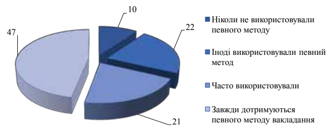
Рис. 3. Результати анкетування викладачів щодо вибору певного методу викладання, %

За даними, представленими на рис. 3, найбільша частка відповідей припадає на варіант «завжди дотримуюсь певного методу викладання», що свідчить про високу якість наданих освітніх послуг, відповідальне ставлення до виконуваної викладачами роботи тощо.